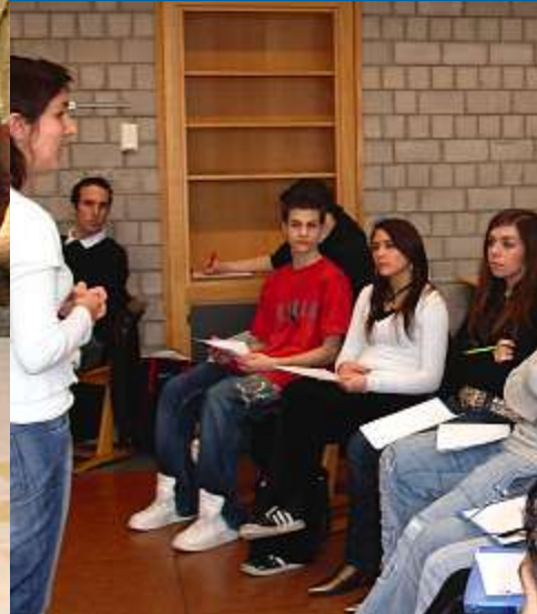
LYCÉE TECHNIQUE DE BONNEVOIE